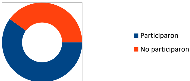
Gráfico 2: Ganadores

Descripción: Este gráfico entrega la información con respecto al porcentaje de participación de los estudiantes del profesor por asignaturas (cursos).